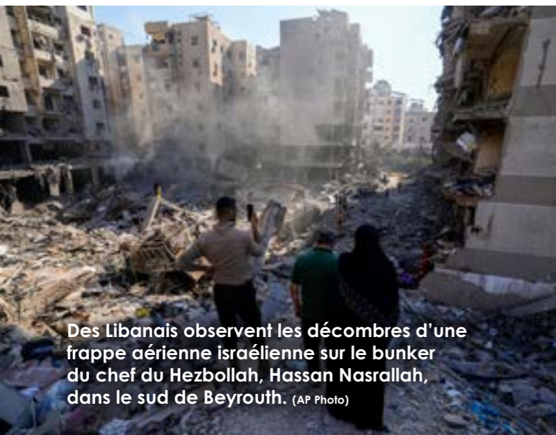
Des Libanais observent les décombres d'une frappe aérienne israélienne sur le bunker du chef du Hezbollah, Hassan Nasrallah, dans le sud de Beyrouth.

Pourtant, d'autres batailles s'annoncent et les Israéliens auront besoin de plus de temps pour surmonter le choc du massacre du 7 octobre. En effet, les blessures infligées à Israël en ce sombre samedi resteront ouvertes tant qu'il y aura des otages à Gaza.