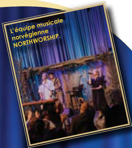
L'équipe musicale norvégienne NORTHWORSHIP.