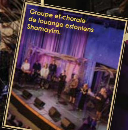
Groupe et-chorale de louange estoniens Shamayim.