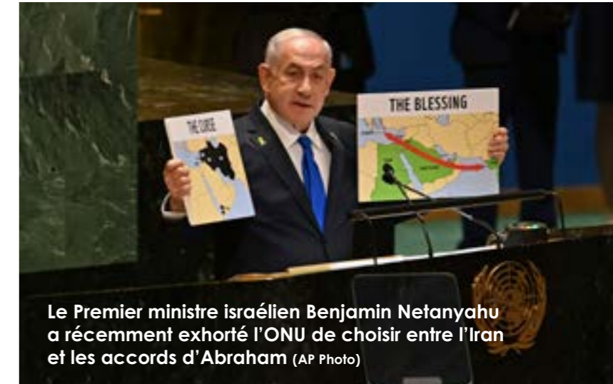
Le Premier ministre israélien Benjamin Netanyahu a récemment exhorté l'ONU de choisir entre l'Iran et les accords d'Abraham

À l'époque, Tsahal avait réussi à prendre pour cible deux généraux iraniens à Damas, ce qui avait incité Téhéran à riposter en lançant plus de 350 missiles balistiques et de