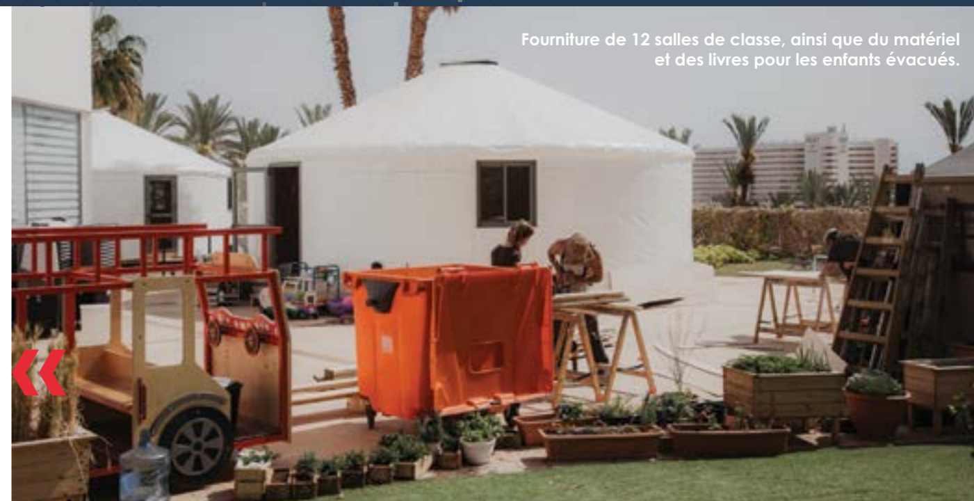
Fourniture de 12 salles de classe, ainsi que du matériel et des livres pour les enfants évacués.